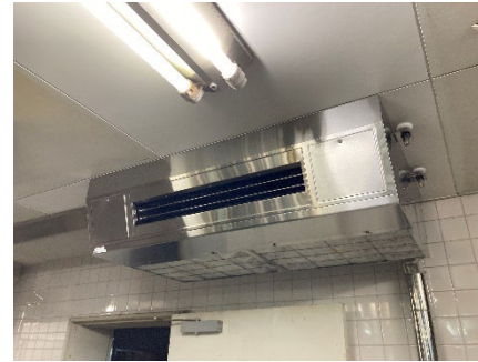
〈1F厨房：天吊り型マルチパッケージ形空調機〉