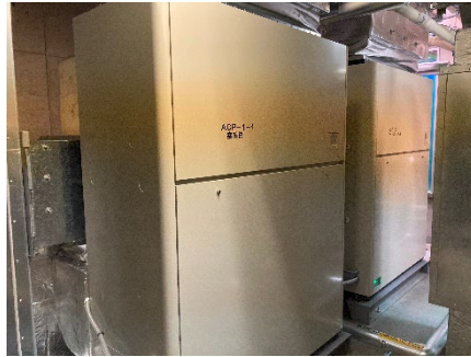
〈2F機械室：床置き型パッケージ形空調機〉