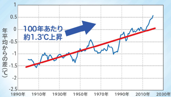
日本の年平均気温偏差