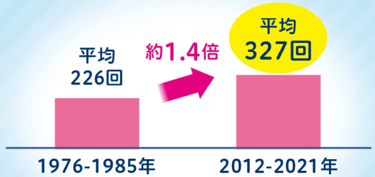
1時間雨量50mm以上の発生回数