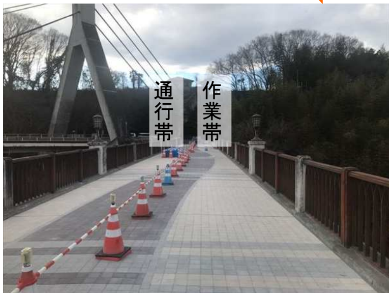
中央付近から左岸（中寺尾）側を望む 【写真④】