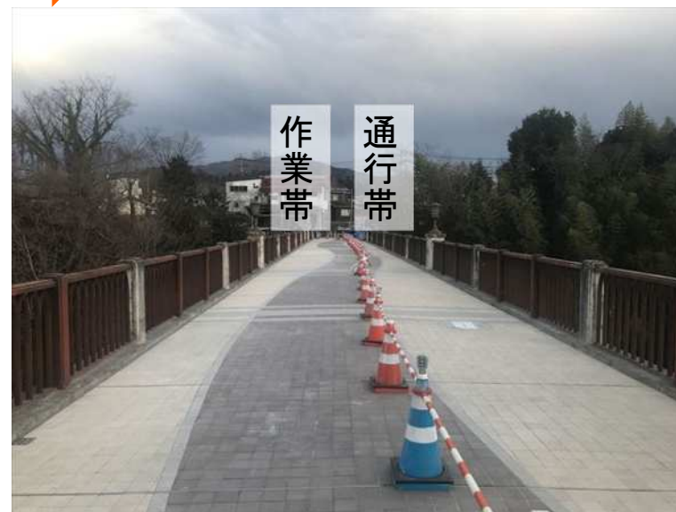
中央付近から右岸（阿保町）側を望む 【写真③】