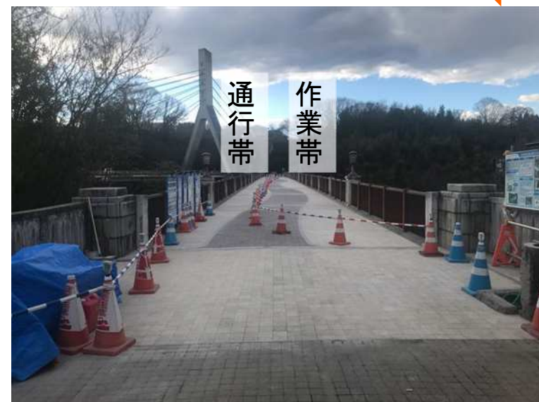
右岸（阿保町）側から左岸側を望む 【写真①】