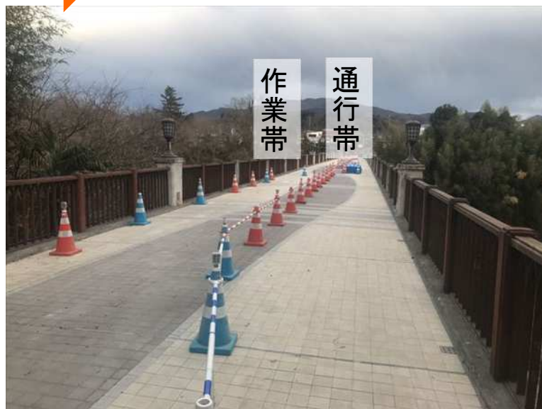
左岸（中寺尾）側から右岸側を望む 【写真②】