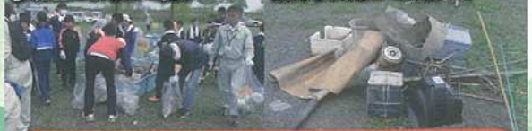
集められたゴミの山