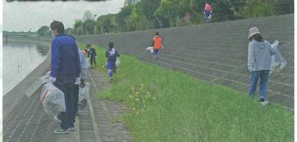
参加者によるゴミ拾い