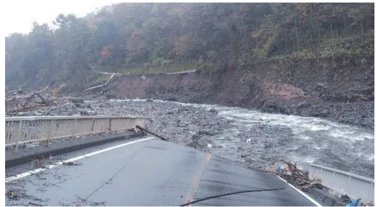
落橋した鳴岩橋から長野原町方面を望む (上流側から下流を望む)