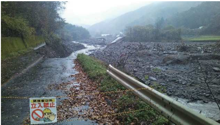
長野原町方面から上田市方面を望む (下流側から上流を望む)