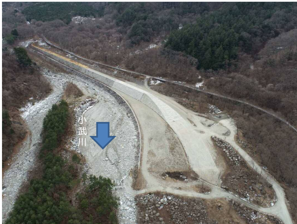
下流側より上流撮影