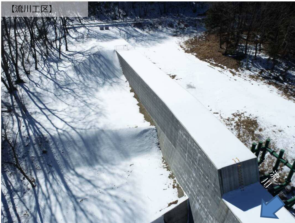
下流側より右岸撮影