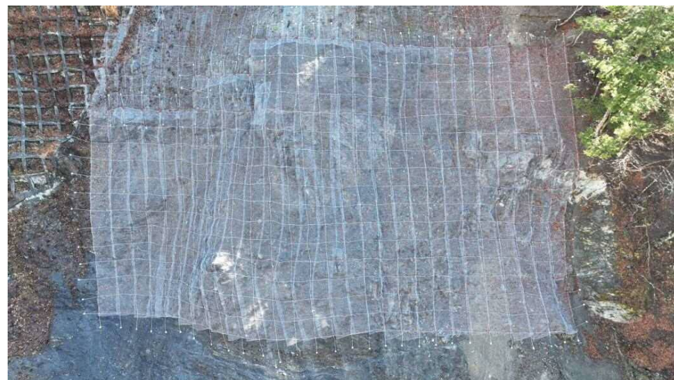
上空より施工箇所（近景）を望む

中島砂防堰堤の改築にあたり、支障となる右岸崩壊地からの落石対策を行う斜面对策工事。前年度工事から継続。工事完成。