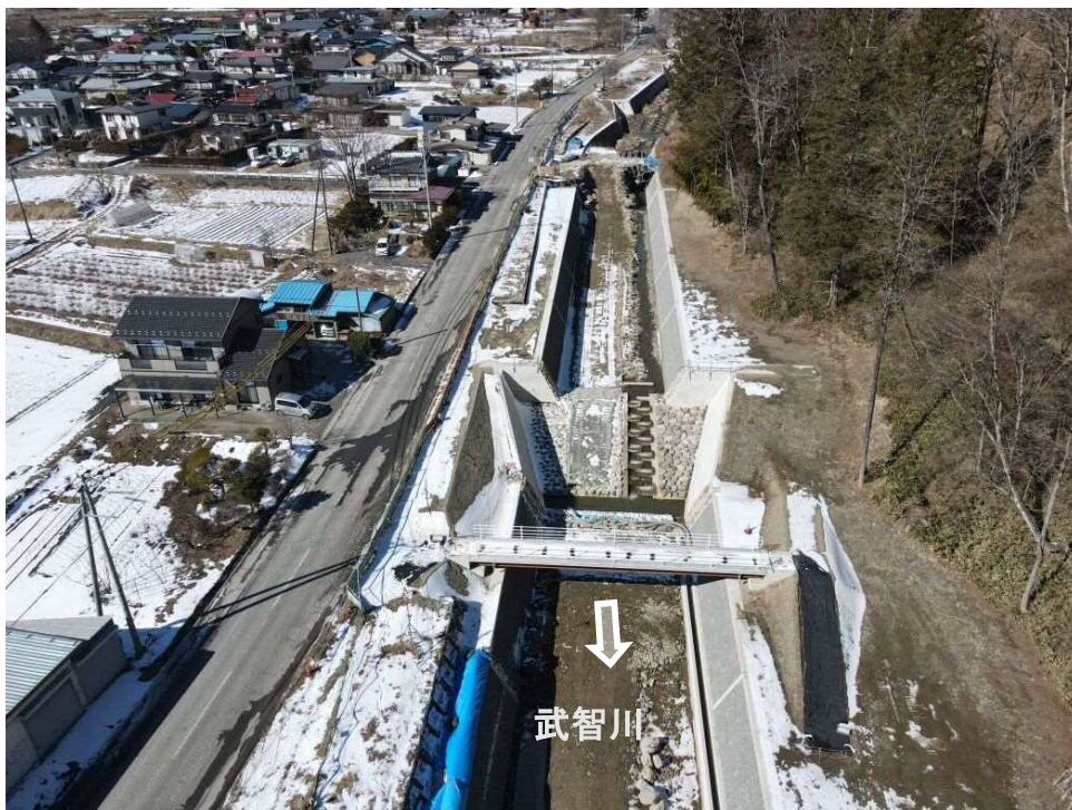
上空より人道橋より上流を望む