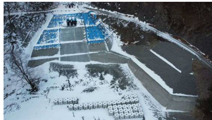
↑ 上空より施工箇所を望む（J K地区：中島砂防堰堤上流）

令和元年10月の台風による出水で被災した釜無川工事用道路の補修等を実施する工事。 現在、盛土工（A地区・I地区）と擁壁工（A地区）の作業が完了し、根固めブロック工（I地区、JK地区）を実施中。