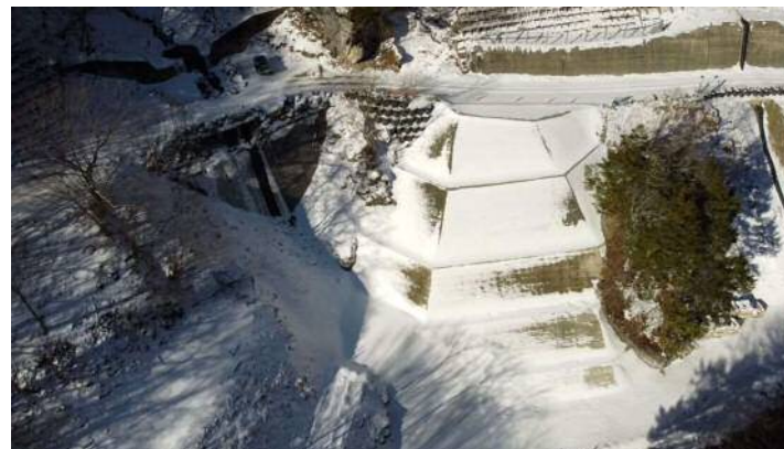
↑ 上空より施工箇所を望む（I地区：中島砂防堰堤下流）