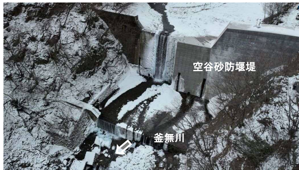
【着手前】下流 上空より本堰堤を望む （コンクリート堰堤工）

既設空谷砂防堰堤に嵩上げ及びアンカー工を設置し、改築する工事。前年度から継続施工し、洪水・土砂氾濫被害を防止・軽減する。現在、工事着手に向け測量等を実施中。