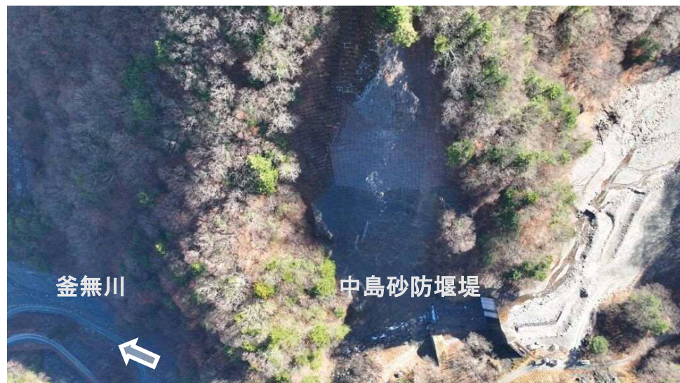
上空より施工箇所（全景）を望む