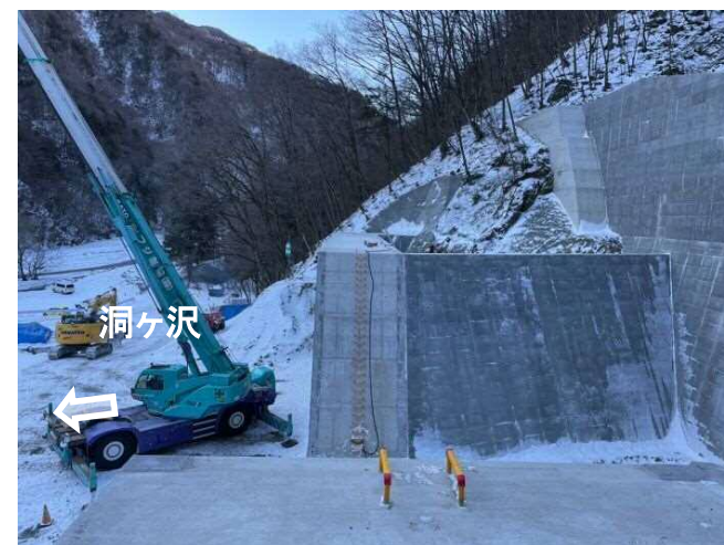
左岸より右岸を望む→

既設洞ヶ沢第二砂防堰堤の副堰堤下流側に腹付けコンクリートで補強し、改築する工事。前年度工事からの継続で、洪水・土石流氾濫被害を防止・軽減する。現在、副堤の腹付け作業が完了し、側壁工背面の埋め戻し、護床工を実施中。