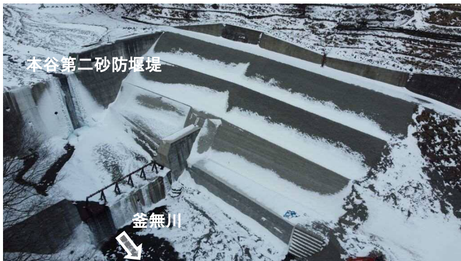
上空より施工箇所を望む（A地区）