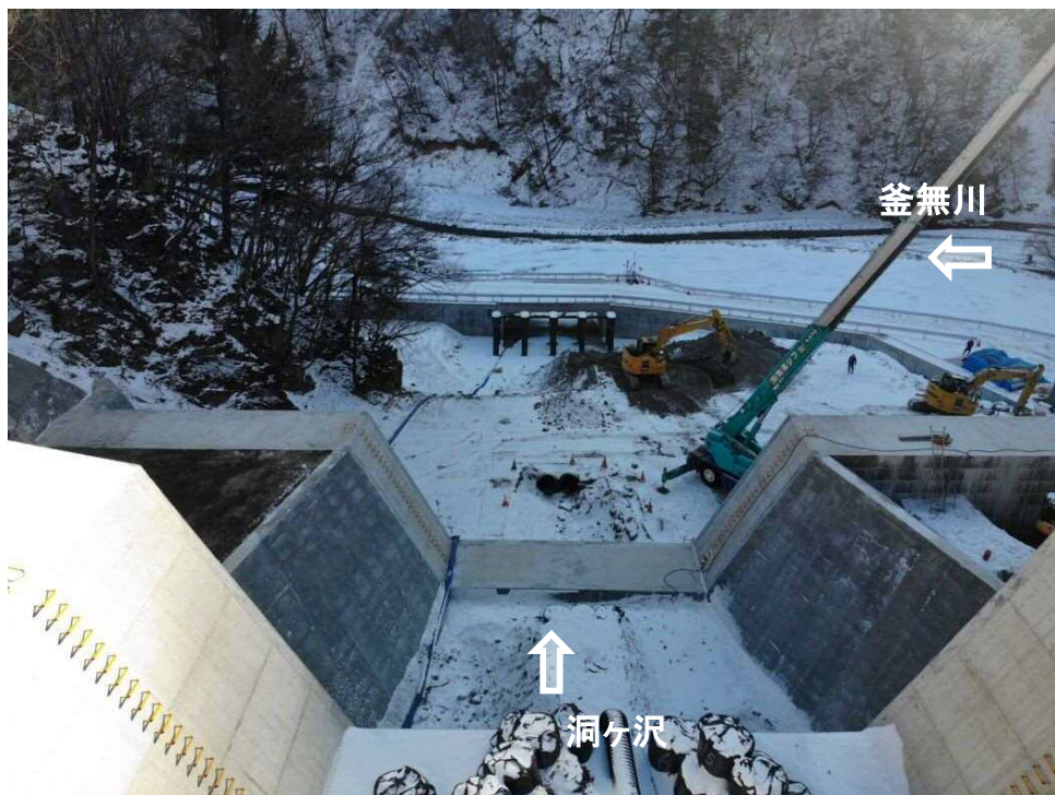
上流上空より施工箇所を望む