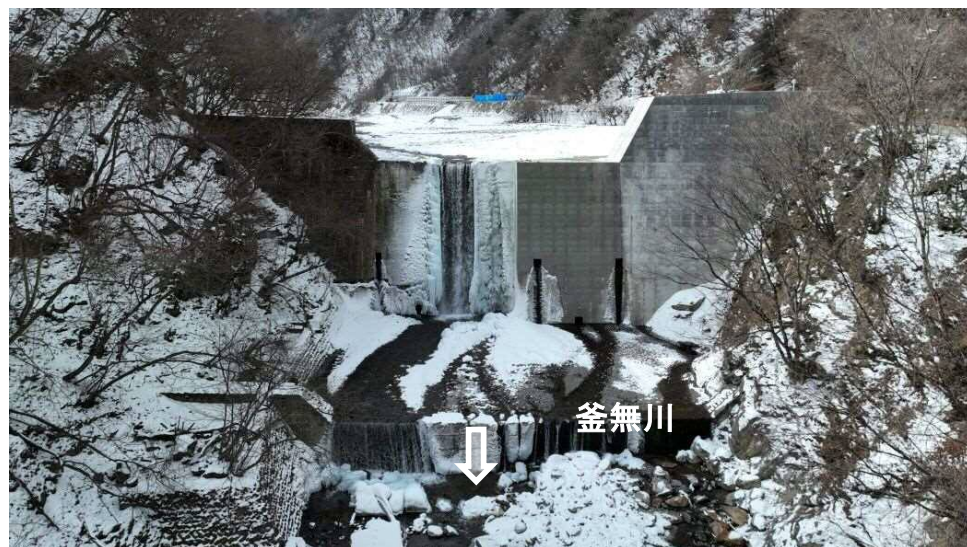
【着手前】下流より本堰堤を望む（コンクリート堰堤工）