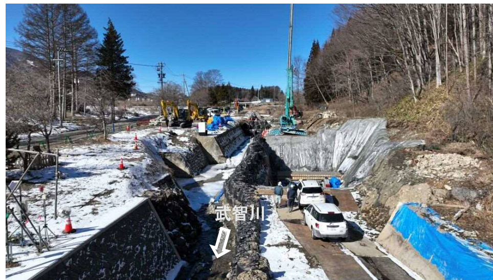
上流上空より施工箇所を望む

武智川下流床固群のうち、床固工、帯工及び護岸を施工し、土砂・洪水を安全に流下させ、土砂災害を防止する工事。現在、左岸側の第10床固工（本堤、副堤）を実施中。