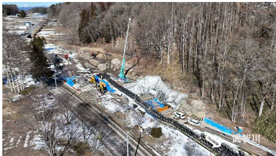
下流上空より施工箇所を望む