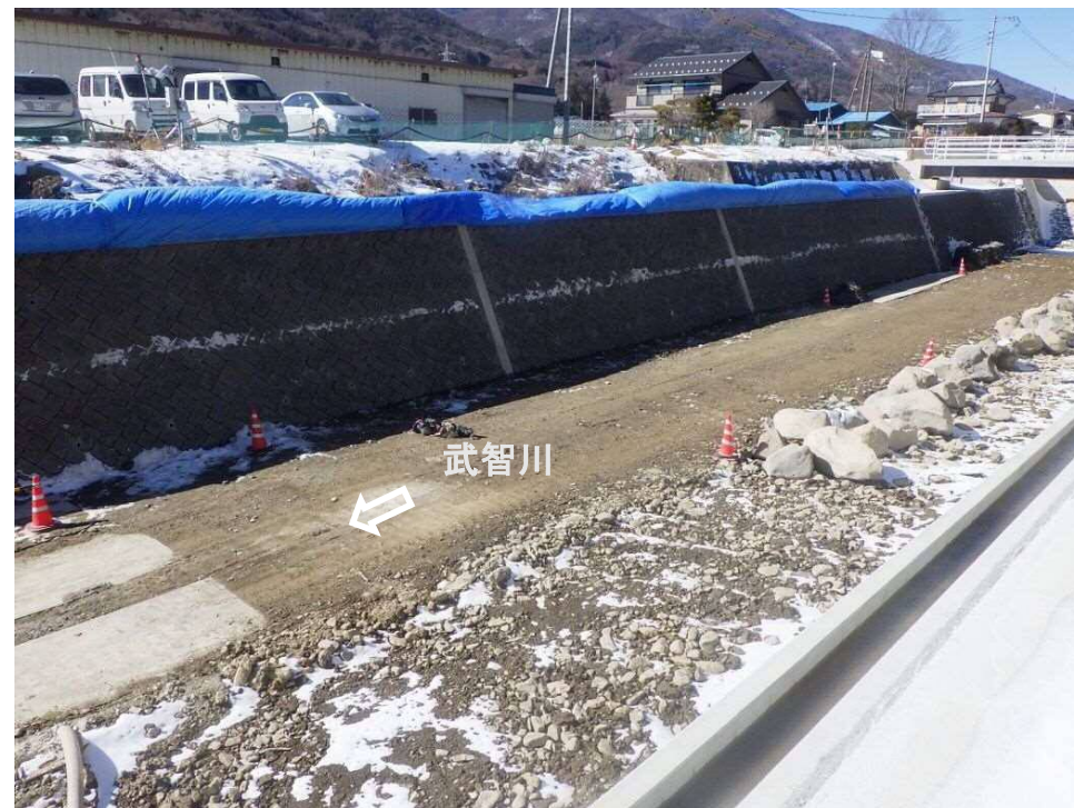
下流左岸より流路護岸工 ブロック積擁壁工 施工箇所を望む

武智川下流床固群のうち、床固工、帯工、護岸及び人道橋を施工し、土砂・洪水を安全に流下させ、土砂災害を防止する工事。