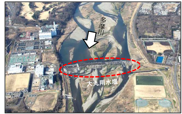
現在の大丸用水堰