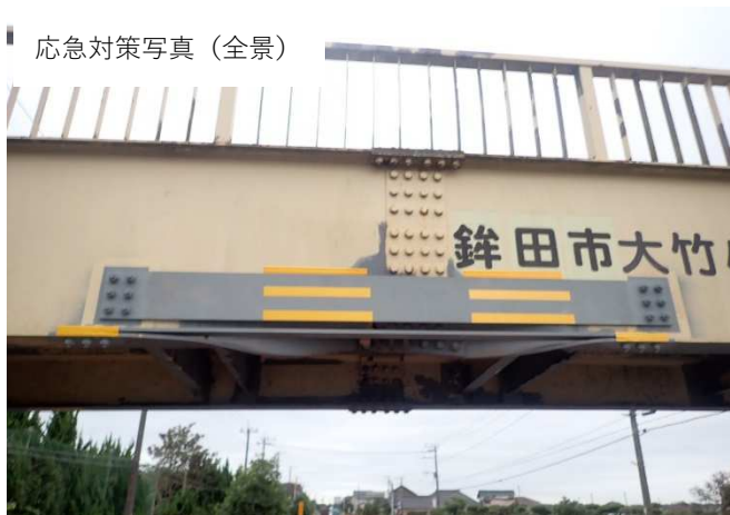
応急対策写真（全景）