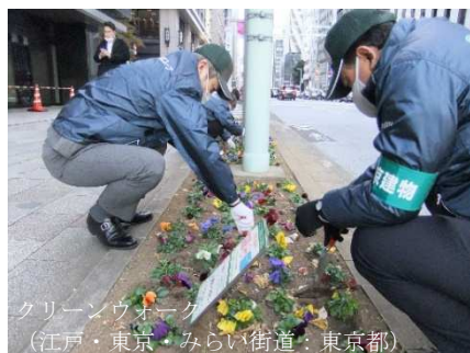
クリーンウォーク (江戸・東京・みらい街道：東京都)

[ホームページアドレス https://www.mlit.go.jp/road/sisaku/fukeikaidou/ ]