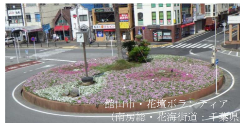
館山市・花壇ポランティア (南房総・花海街道：千葉県)