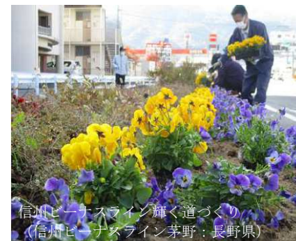
信州バスライン花く道づくり (信州バスライン茅野：長野県)