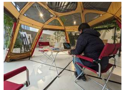
昨年度の実証実験の様子(花みどり文化センター内ギャラリースペース利用)