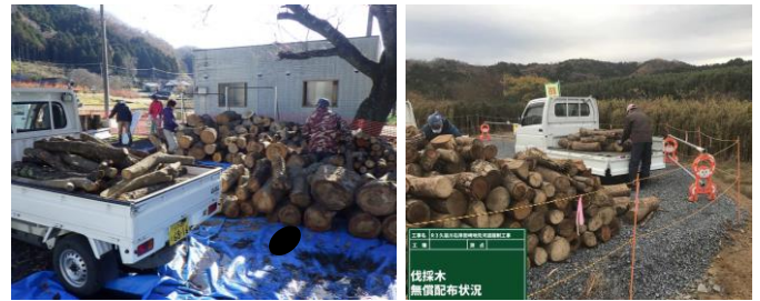
▲常陸大宮市家和楽地先 ▲常陸大宮市岩崎地先

今後も引き続き、伐採木が発生した場合には、資源の有効活用と処分費の削減のため、無償配布を行っています。無償配布が行われる際には、事務所HPにて告知も行っておりますので、ご確認ください。