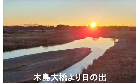
木島大橋より日の出

〇地域の皆様におかれましては、日頃より久慈川緊急治水対策プロジェクトにご理解とご協力をいただきありがとうございます。 プロジェクトの早期完了に向けて、今年も引き続き用地交渉や工事等を進めてまいりますので、よろしくお願いいたします。