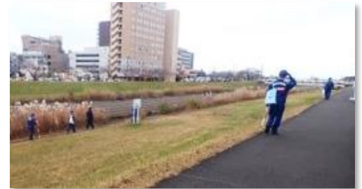
堤防点検状況（桜川）