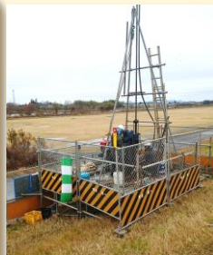
ボーリング調査の状況