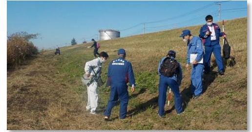
堤防点検状況（那珂川）