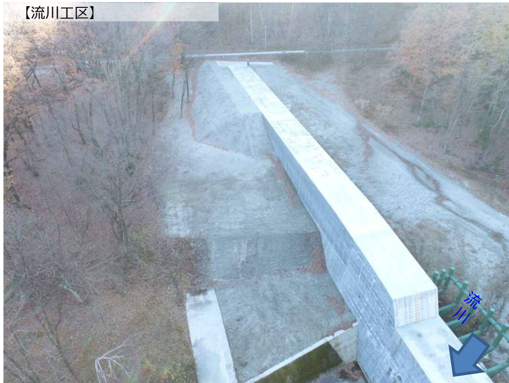
下流側より右岸撮影