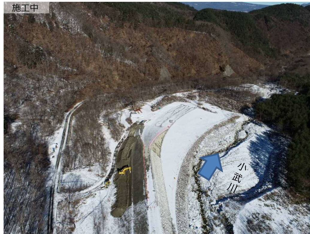
上流側より下流撮影

小武川中流部において、土砂災害を防ぐため、砂防堰堤の一部となる導流堤を設置する工事を行っています。