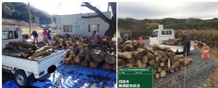
▲常陸大宮市家和楽地先

今後も引き続き、伐採木が発生した場合には、資源の有効活用と処分費の削減のため、無償配布を行ってまいります。無償配布が行われる際には、事務所HPにて告知も行っておりますので、ご確認ください。