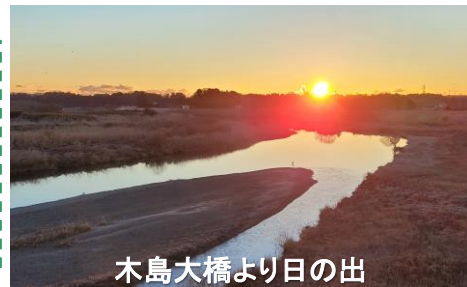
木島大橋より日の出

プロジェクトの早期完了に向けて、今年も引き続き用地交渉や工事等を進めてまいりますので、よろしくお願いいたします。