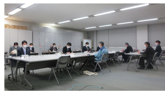
関東地方流域治水連絡会議との連絡・調整