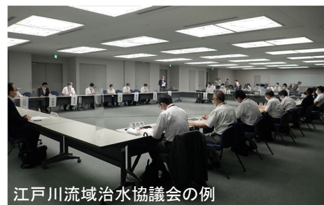
各流域治水協議会との連絡・調整