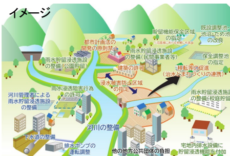
特定都市河川流域における取組推進