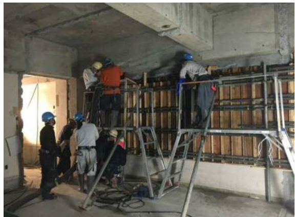
耐震壁コンクリート打設