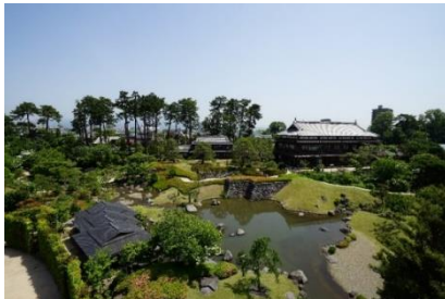
りんこうかく にほんていえん 臨江閣と日本庭園