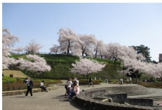
まえばしこうえん はなみ 前橋公園の花見