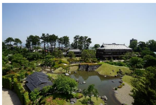
りんこうかく にほんていえん 臨江閣と日本庭園

本計画では、市内に残る歴史的建造物の保存活用・未指定建造物の調査に関する事業や、歴史情緒をさらに高めるための道路高質化・環境整備、まち並みのアクセントとなる歴史性を象徴する建造物等の復元・集客施設の整備等を位置付け、歴史的風致の維持及び向上を図っていくこととしています。