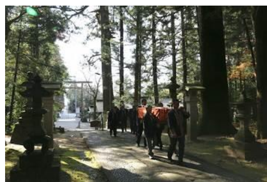
にのみやあかぎじんじゃ ごじんこう 二宮赤城神社の御神幸