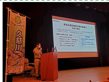
安全の取り組み発表 (小林建設)

受注者55社 (WEB参加39社) が参加し、受注者代表による現場の取り組みの発表や、茨城労働局による講話など、安全対策について再確認しました。また、新型コロナウイルス感染症対策として、出席者を限定し、マスク着用、3密対策を徹底し行いました。