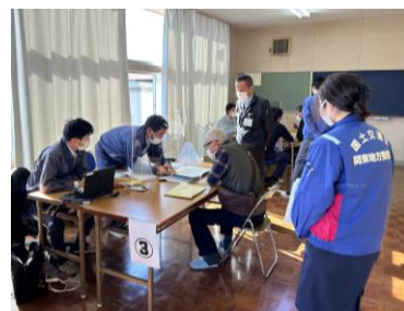
用地個別説明状況 ▶

常陸大宮市小貫南地区にて、河道掘削・堤防整備にご協力いただく地権者を対象とした、用地個別説明会を令和4年11月27日(日)及び28日(月)に行いました。説明会では、計36名の方にお越しいただき、新型コロナウイルス感染症対策に配慮しながら、地権者の方ひとりひとりに令和4年2月に実施した境界立会の用地・物件の調査結果を基に補償説明をさせていただきました。