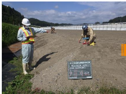
テープでの計測による従来の管理方法 地上型レーザースキャナーによる土量計測

▶ 従来は整形した土砂をテープ等で計測し土量を算出していましたが、この『地上型レーザースキャナー』を使えば、ボタン一つで3次元的に土量の計測が可能です。