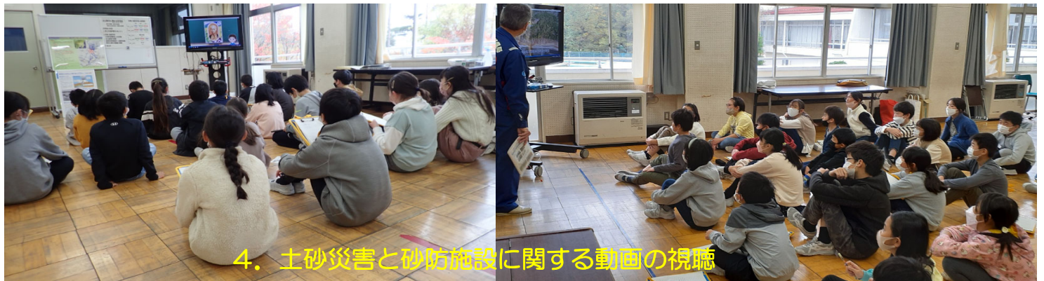
4. 土砂災害と砂防施設に関する動画の視聴