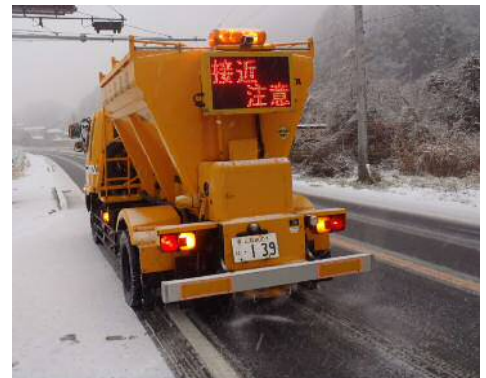
凍結防止剤散布車

凍結防止剤を散布することで路面の凍結を防ぎ、安全な走行を確保する目的で使用する除雪車両です。