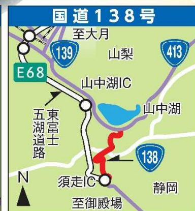
国道138号 山中湖・須走 山梨県山中湖村平野～ 静岡県小山町 須走字御登口(8.2km)