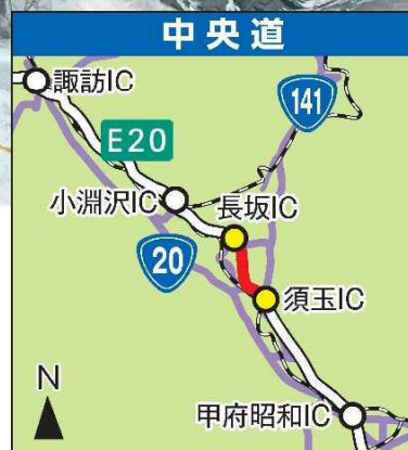
E20 中央道 須玉IC～長坂IC(8.7km)

「大雪特別警報」や「大雪に関する緊急発表」が行われるような異例の大雪発生時は、降雪や交通状況に応じて「チェーン規制」を行います。「チェーン規制」を実施した場合は、チェーンを装着していない車両は通行できなくなります。