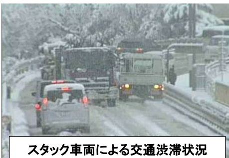
スタック車両による交通渋滞状況

例年、急勾配、カーブ箇所等において立ち往生する車両が見受けられます。「通行止め」になる恐れもありますので、滑り止め対策を確実に実施されるようお願いします。