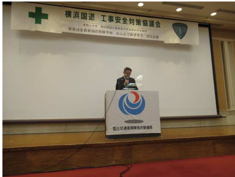
写真 事務所長挨拶