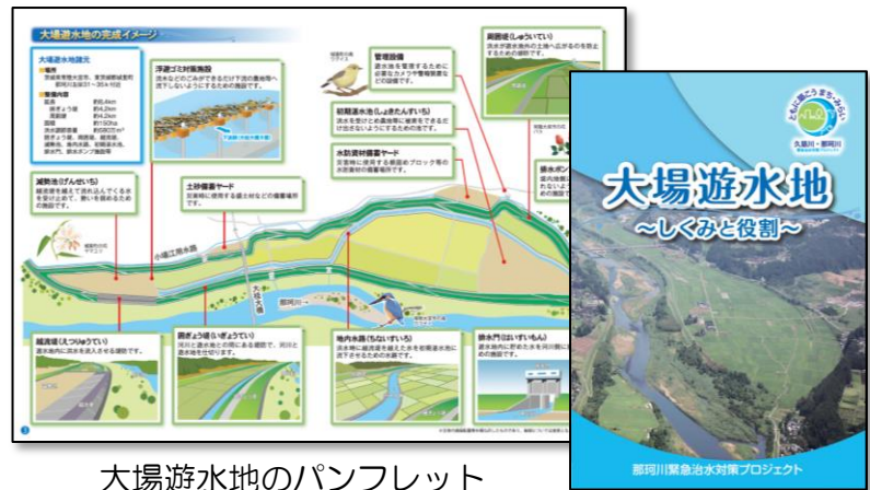
大場遊水地のパンフレット