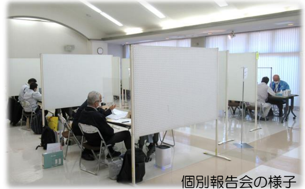
個別報告会の様子