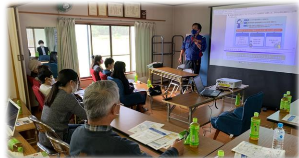
マイ・タイムライン講習の様子 ▶