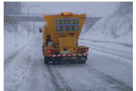
凍結防止剤散布車