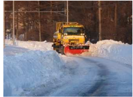
平成26年2月豪雪時 長野県軽井沢地先の国道18号