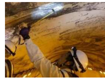
打音検査による変状の把握