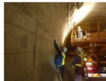
近接目視による変状の把握