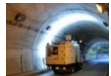
画像計測技術による変状の把握