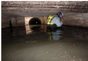
滞水した溝橋内部の目視点検