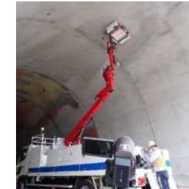
レーザー打音による変状の把握