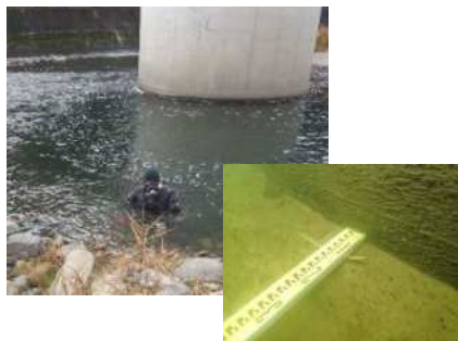
潜水調査による河床洗掘の把握