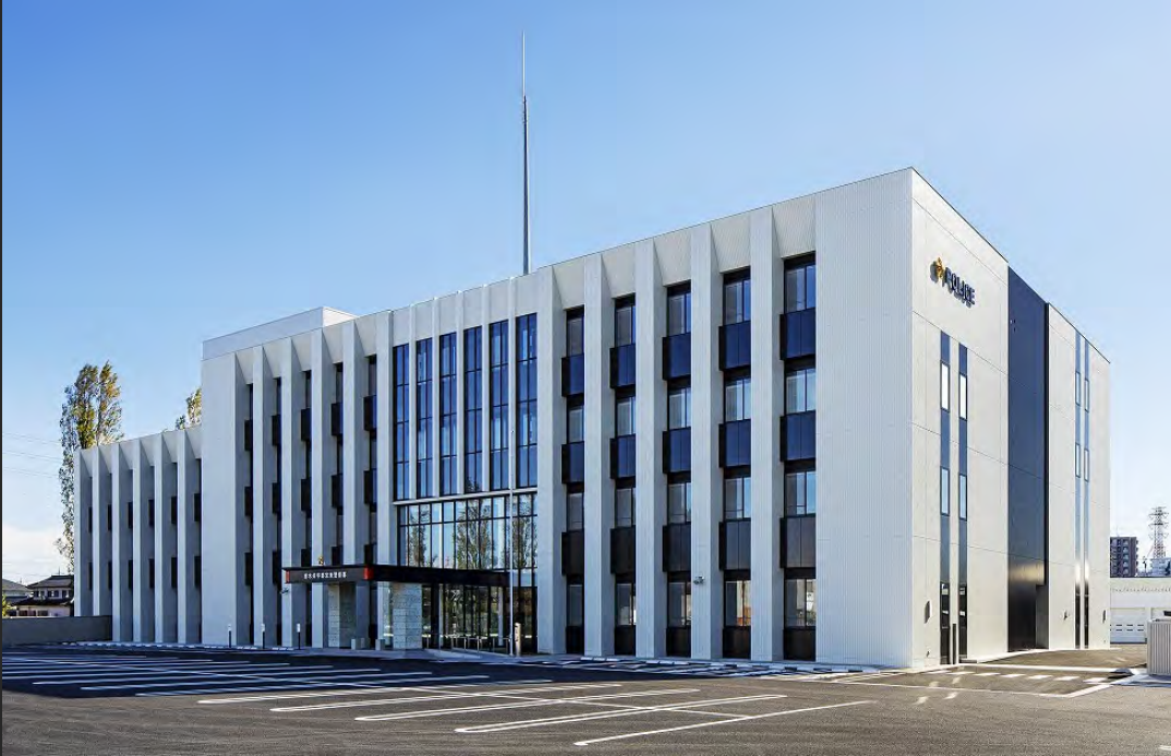
宇都宮東警察署 栃木県

建築業界の皆様はもとより、多くの方にご覧いただき、公共建築に興味をお持ちいただければと思います。