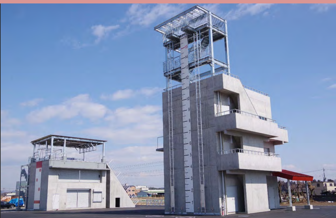
鹿沼市消防訓練棟 鹿沼市