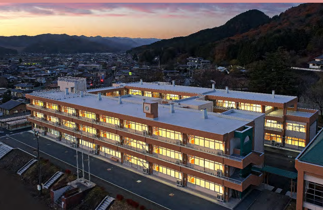
佐野市立葛生義務教育学校 佐野市