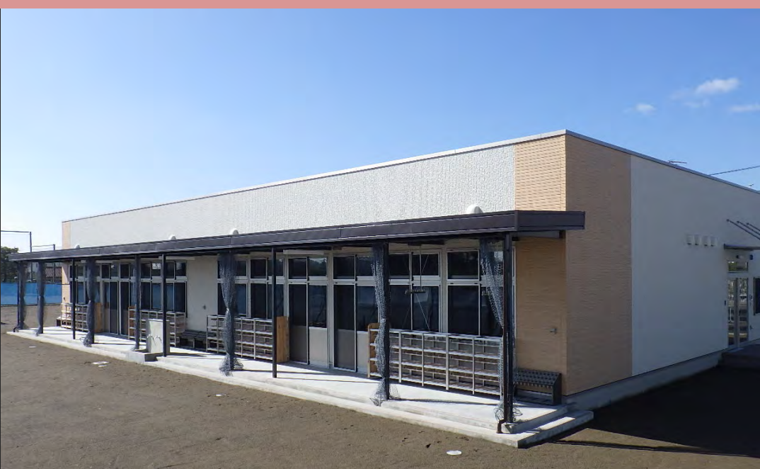
芳賀東小学校学童保育施設 芳賀町