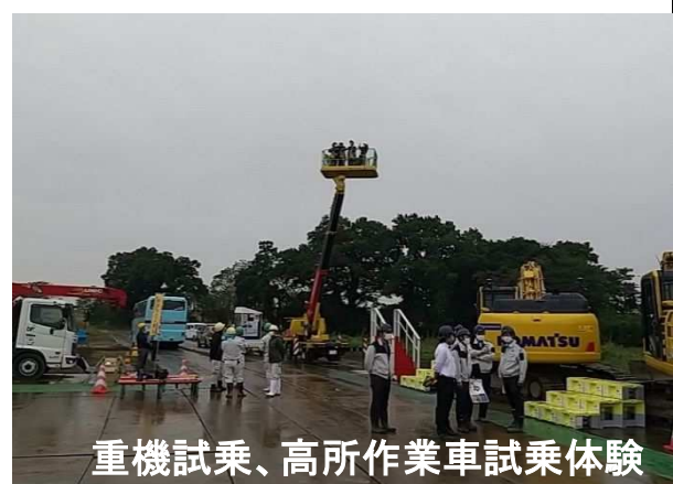
重機試乗、高所作業車試乗体験