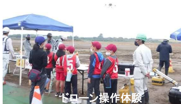
ドローン操作体験