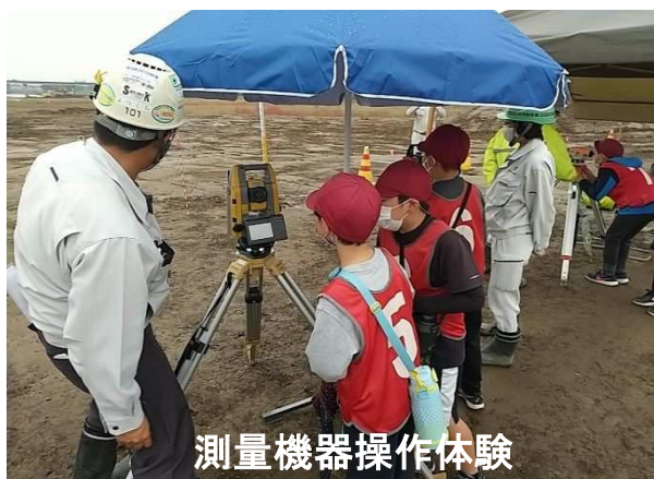
測量機器操作体験