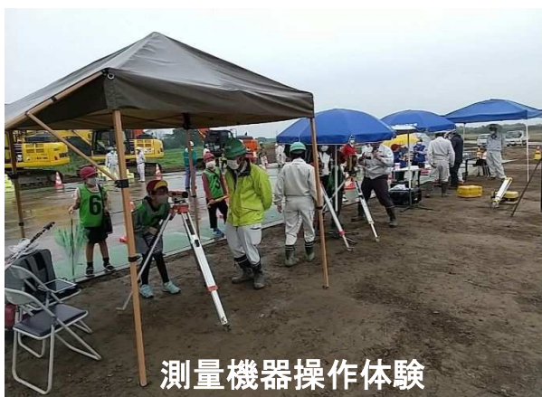
測量機器操作体験