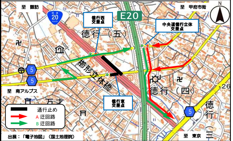
②-2 沿道から立体を經由し国道へ向かう方