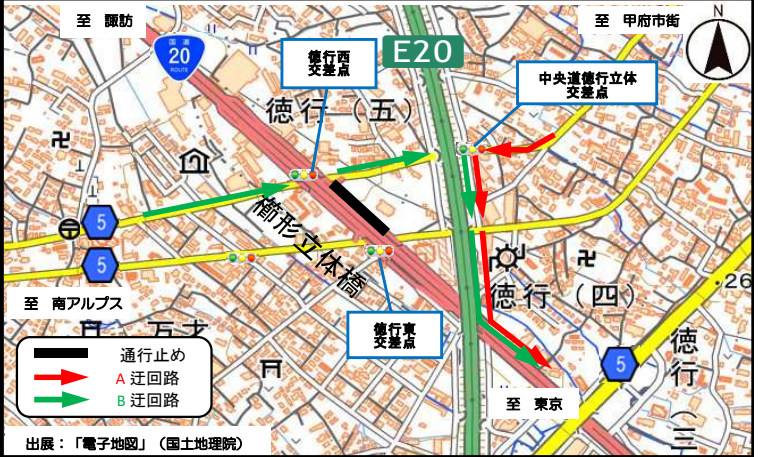
①-2 沿道から立体を經由し国道へ向かう方