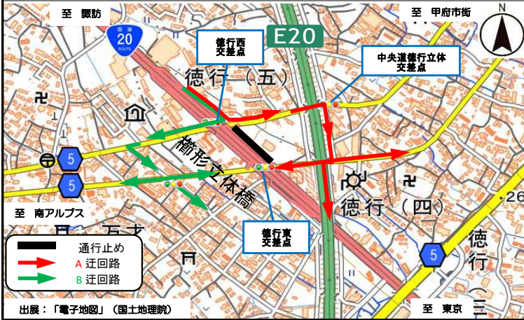
①-1 国道から立体を經由し沿道へ向かう方