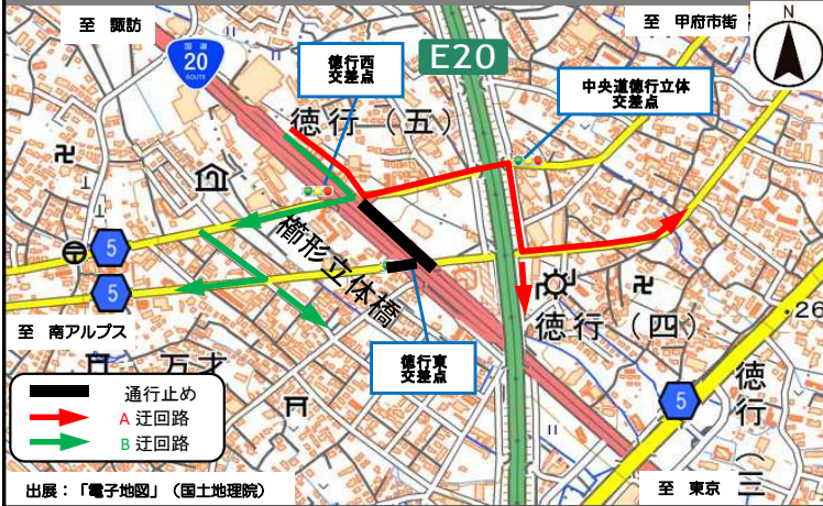
②-1 国道から立体を經由し沿道へ向かう方