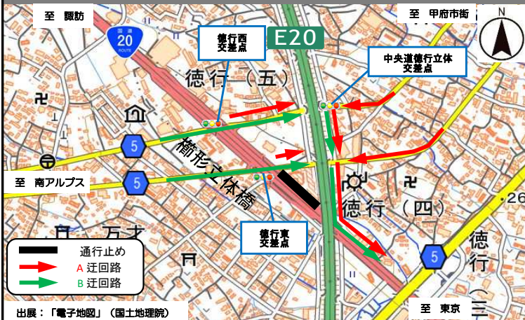
③ 沿道から立体を經由し国道へ向かう方