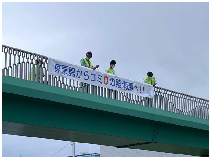
【啓発横断幕の掲示状況】