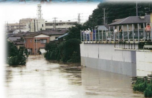
H10.8 水戸市三の丸地区2階建駐車場