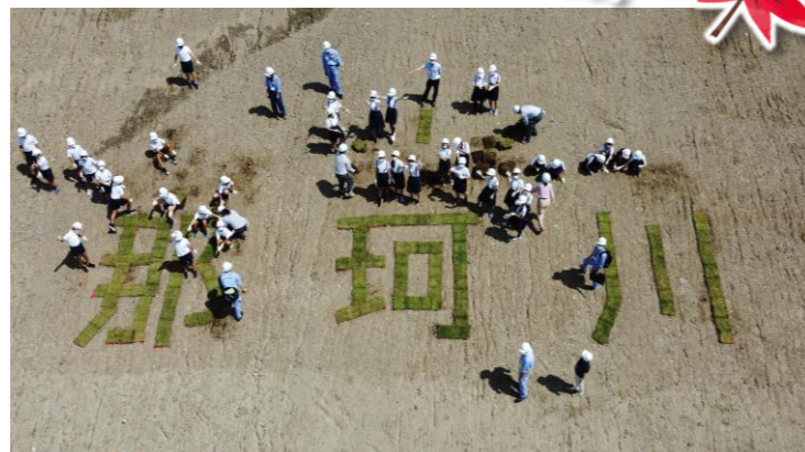
ドローンで撮影した集合写真