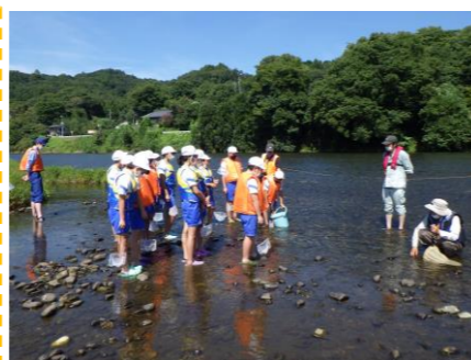
指標生物を採集している様子