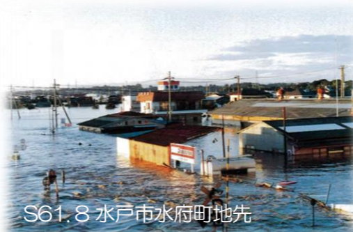
S61.8 水戸市水府町地先