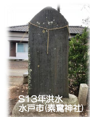
S13年洪水 水戸市(素鷲神社)