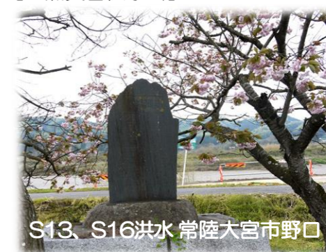
S13、S16洪水 常陸大宮市野口