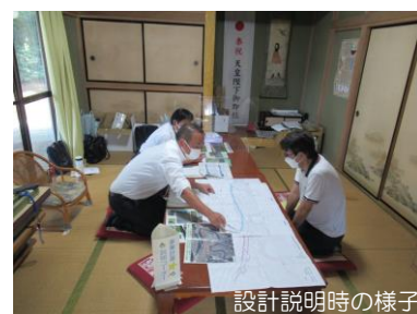
設計説明時の様子