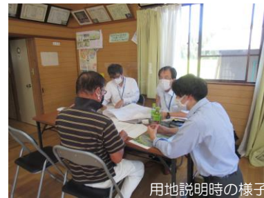
用地説明時の様子

用地説明会に都合が合わず来られなかった方には、改めて個別に対応させていただきます。