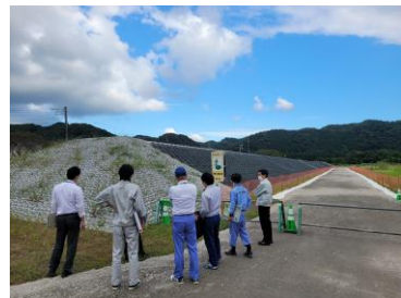
▲西野内地区(常陸大宮市)