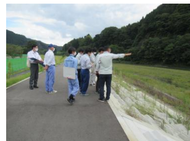
▲家和楽地区(常陸大宮市)