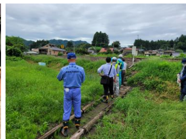
▲境界立会状況の様子