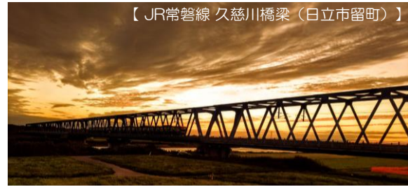
【JR常磐線 久慈川橋梁（日立市留町）】