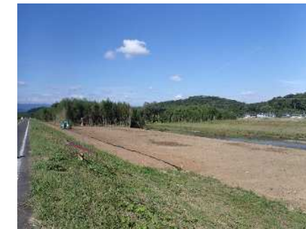
写真② 下流側から上流方向