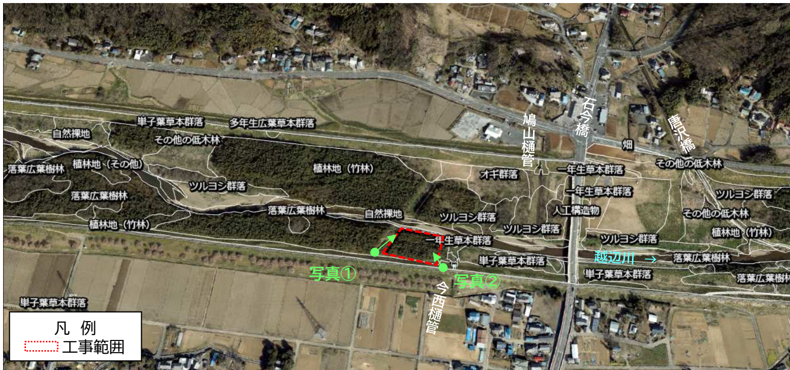
「R3 荒川上流水辺現地調査(基図)業務 報告書」の植生図データより