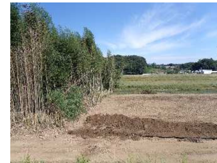
写真① 上流側から下流方向