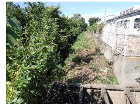
写真① 道路から水路方向