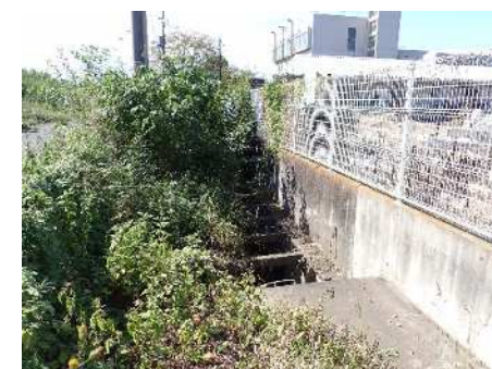
写真② 道路から水路方向