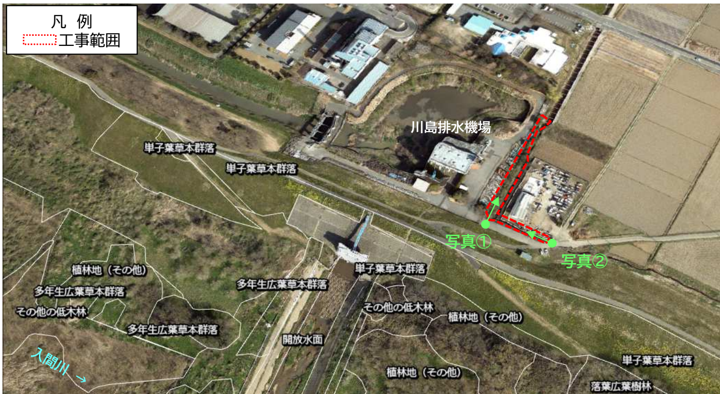
「R3 荒川上流水辺現地調査(基図)業務 報告書」の植生図データより