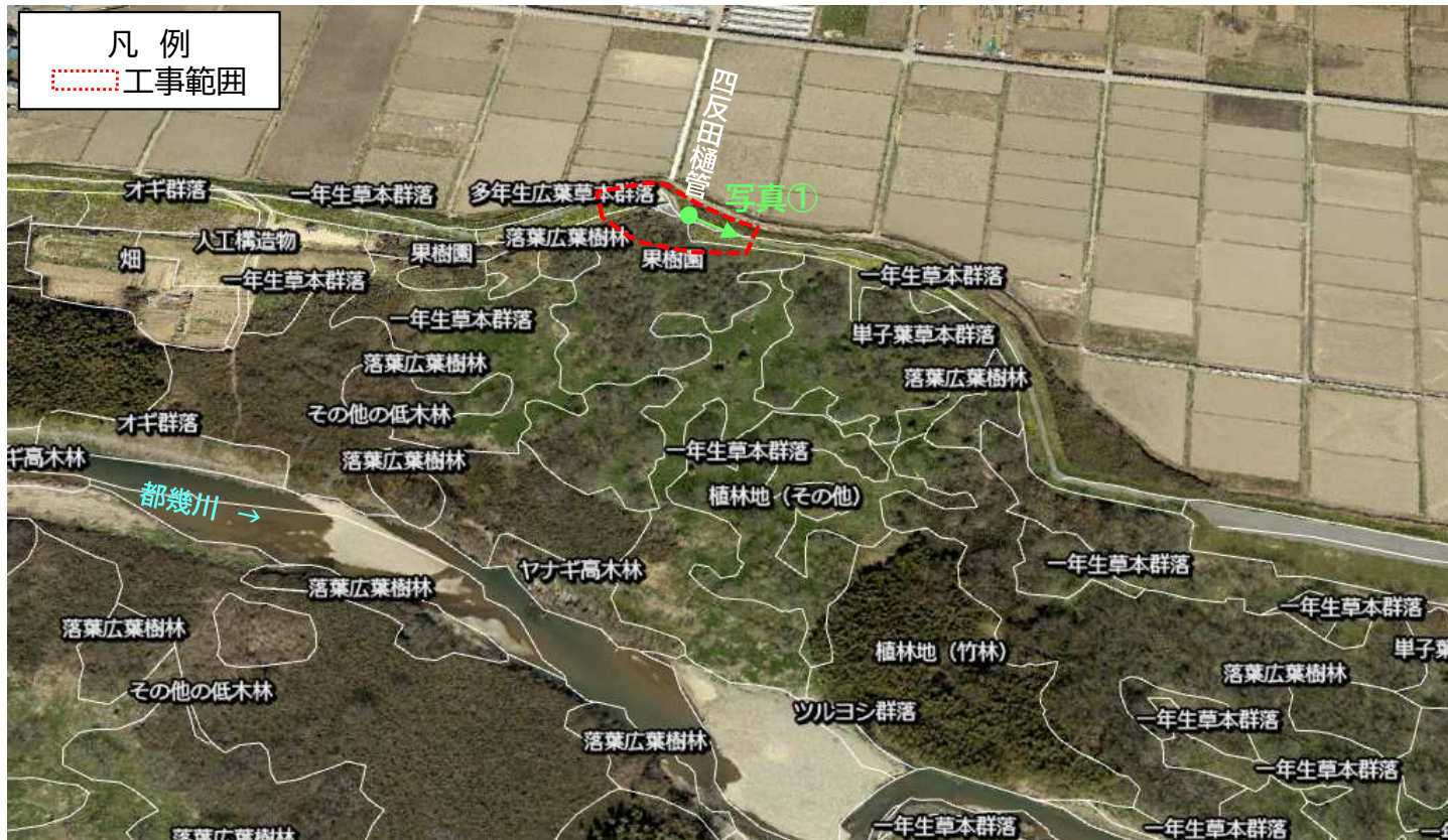
「R3 荒川上流水辺現地調査(基図)業務 報告書」の植生図データより