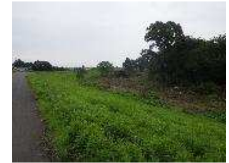
写真① 堤防から下流方向