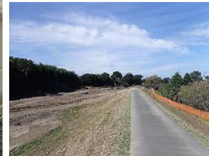
写真① 下流から上流方向