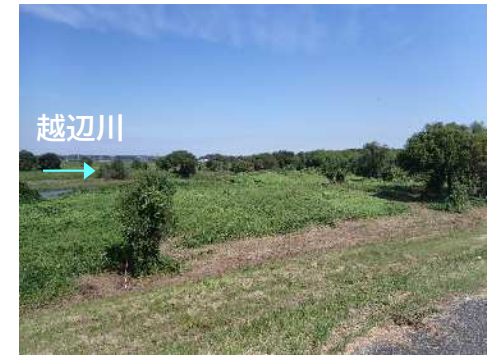
写真① 上流側から下流方向