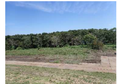
写真② 下流側から上流方向