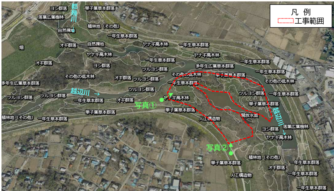
「R3 荒川上流水辺現地調査(基図)業務 報告書」の植生図データより