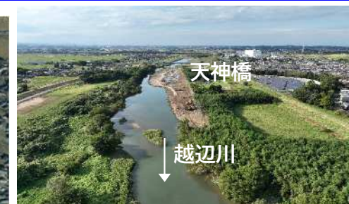
写真① 天神橋下流より上流方向全景