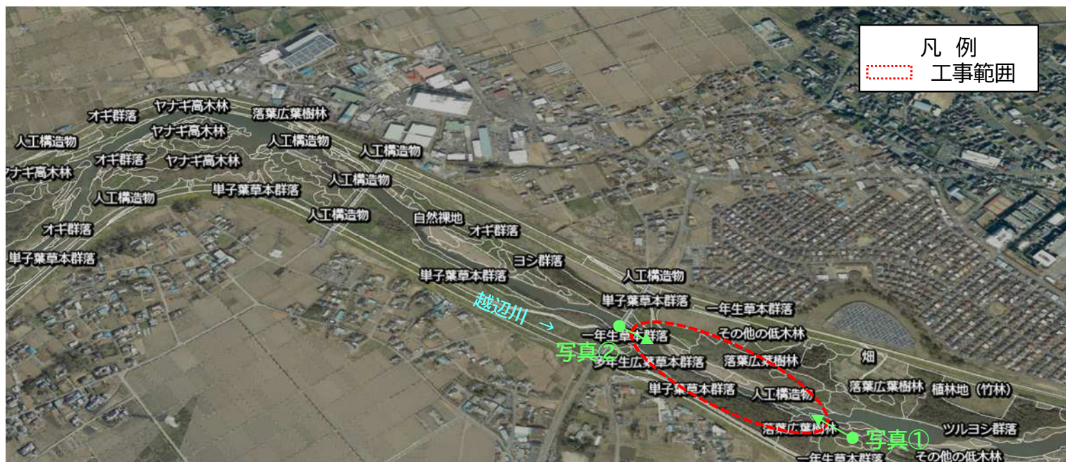
「R3 荒川上流水辺現地調査(基図)業務 報告書」の植生図データより