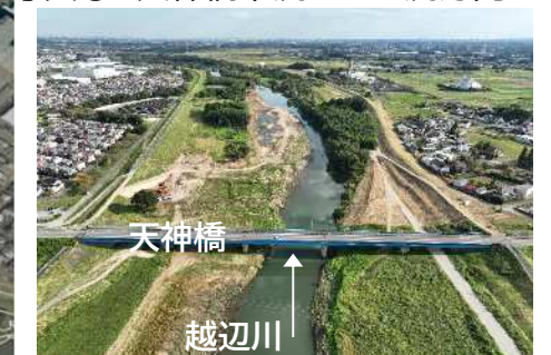
写真② 天神橋より下流方向全景