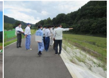
▲西野内地区(常陸大宮市) ▲家和楽地区(常陸大宮市)