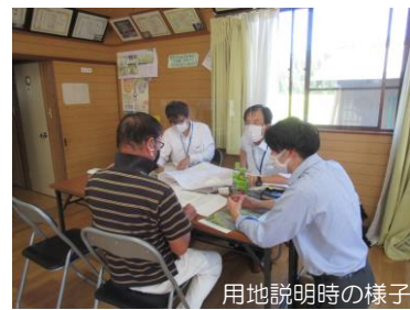
用地説明時の様子

用地説明会に都合が合わず来られなかった方には、改めて個別に対応させていただきます。