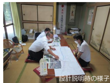
設計説明時の様子