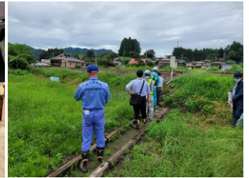
▲設計内容説明の様子