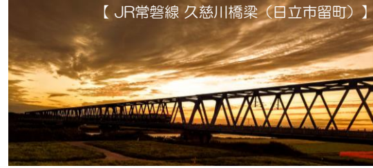
【JR常磐線 久慈川橋梁（日立市留町）】