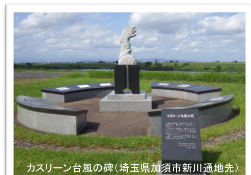
カスリーン台風の碑(埼玉県加須市新川通地先)