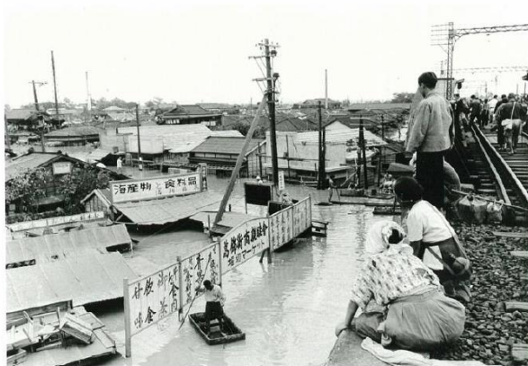
葛飾区の浸水状況