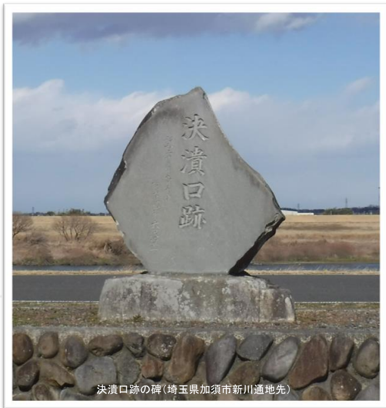
決潰口跡の碑(埼玉県加須市新川通地先)