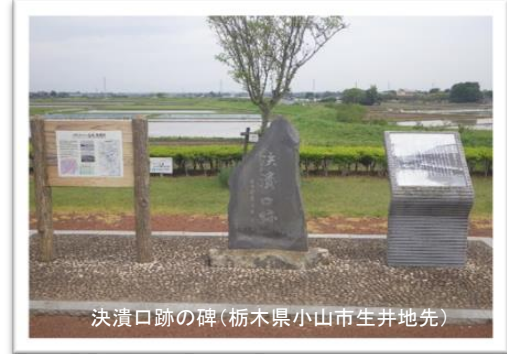
決潰口跡の碑(栃木県小山市生井地先)