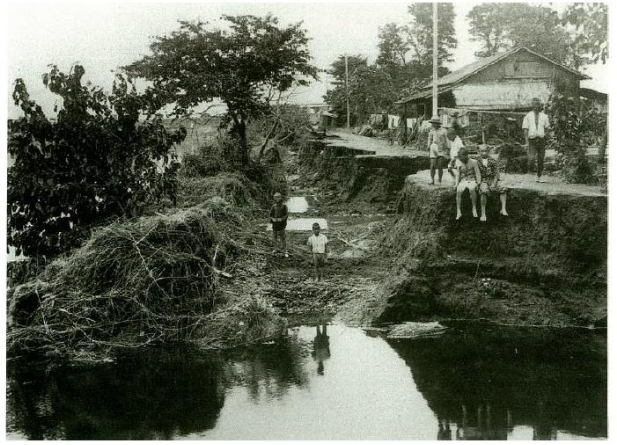
下都賀郡生井村下生井(現:小山市)の被害状況