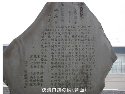
決潰口跡の碑(背面)