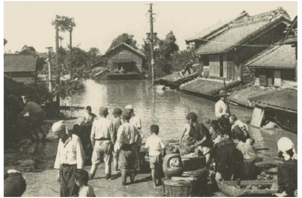
北葛飾郡栗橋町(現:久喜市)の浸水避難状況