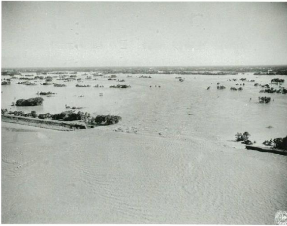
北埼玉郡東村(現:加須市) 決壊状況