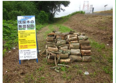
伐採木無償配付場所の状況 ▶

今後も引き続き、伐採木が発生した場合には、資源の有効活用と処分費の削減のため、無償配付を行ってまいります。