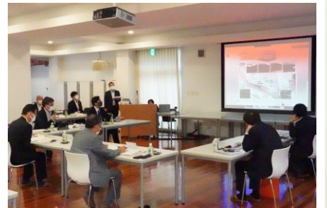
▲大子まちなかビジョン報告会の様子