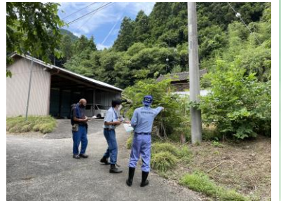
電柱立会状況(大子町頃藤南右岸) ▶

堤防整備に伴い、支障となる電柱及び架空線の現地立ち合いを関係機関と行っています。令和4年8月末時点では、国管理区間と権限代行区間において、計6地区の電柱移設協議を行いました。電柱の移設先の用地や工事のお話で地域の方へ伺うこともございますので、ご理解・ご協力をお願いいたします。