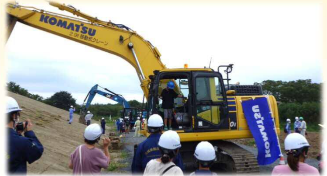
ICT施工機械搭乗体験