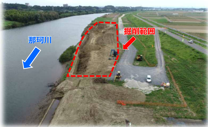
河道掘削工事実施範囲