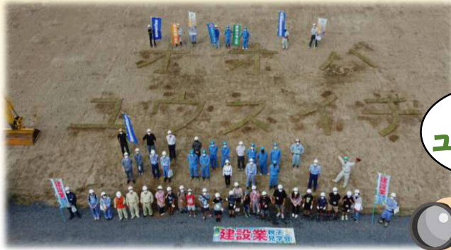
ドローンで撮影した集合写真