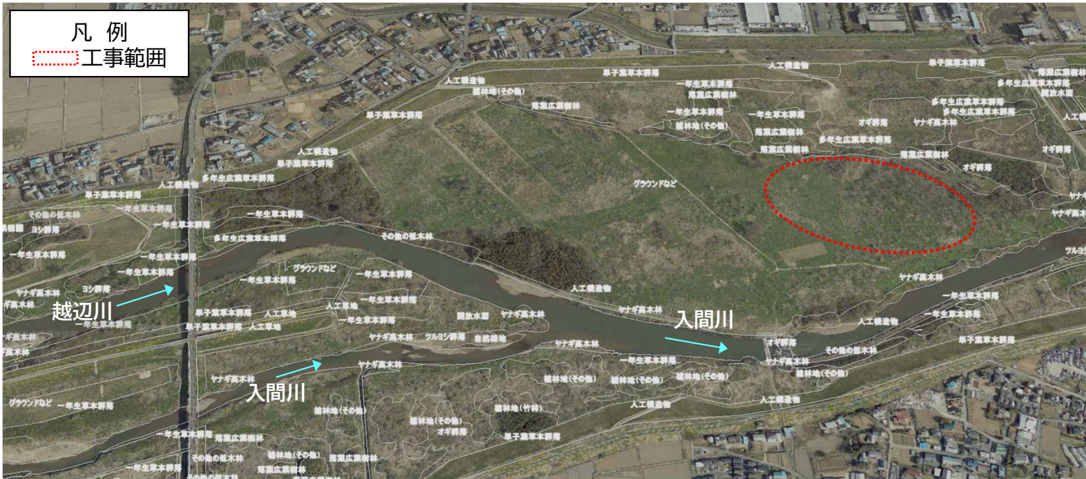
「R3 荒川上流水辺現地調査(基図)業務 報告書」の植生図データより