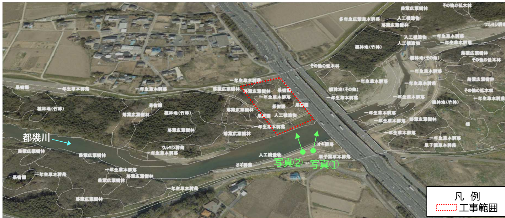
「R3 荒川上流水辺現地調査(基図)業務 報告書」の植生図データより