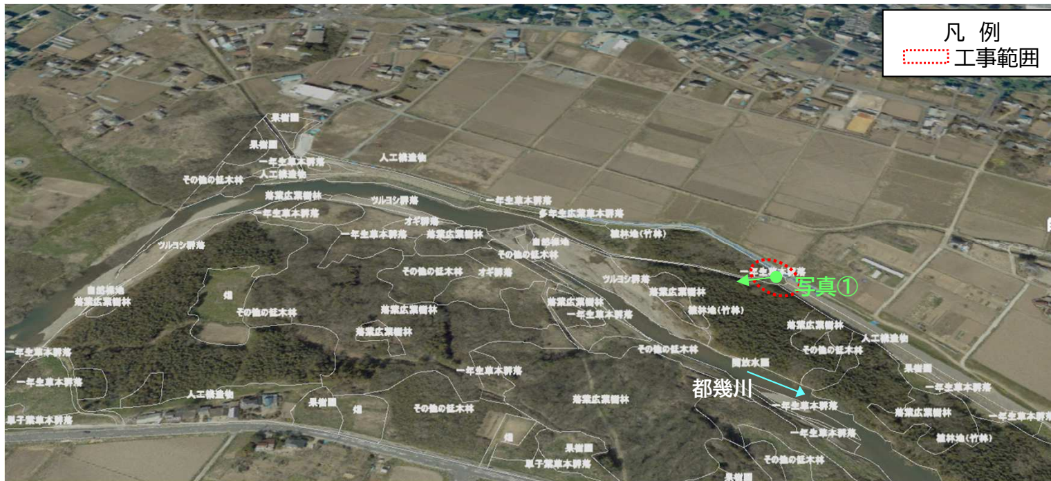
「R3 荒川上流水辺現地調査(基図)業務 報告書」の植生図データより