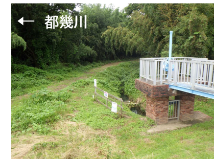
写真① 樋管から上流方向