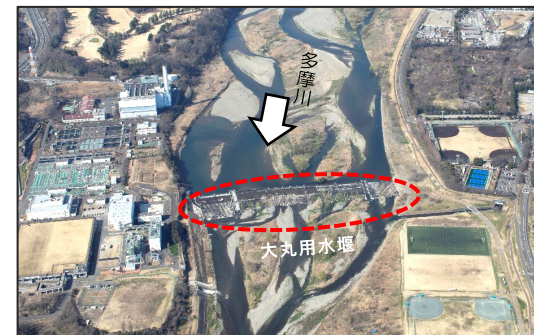
現在の大丸用水堰