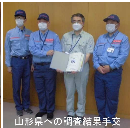
山形県への調査結果手交