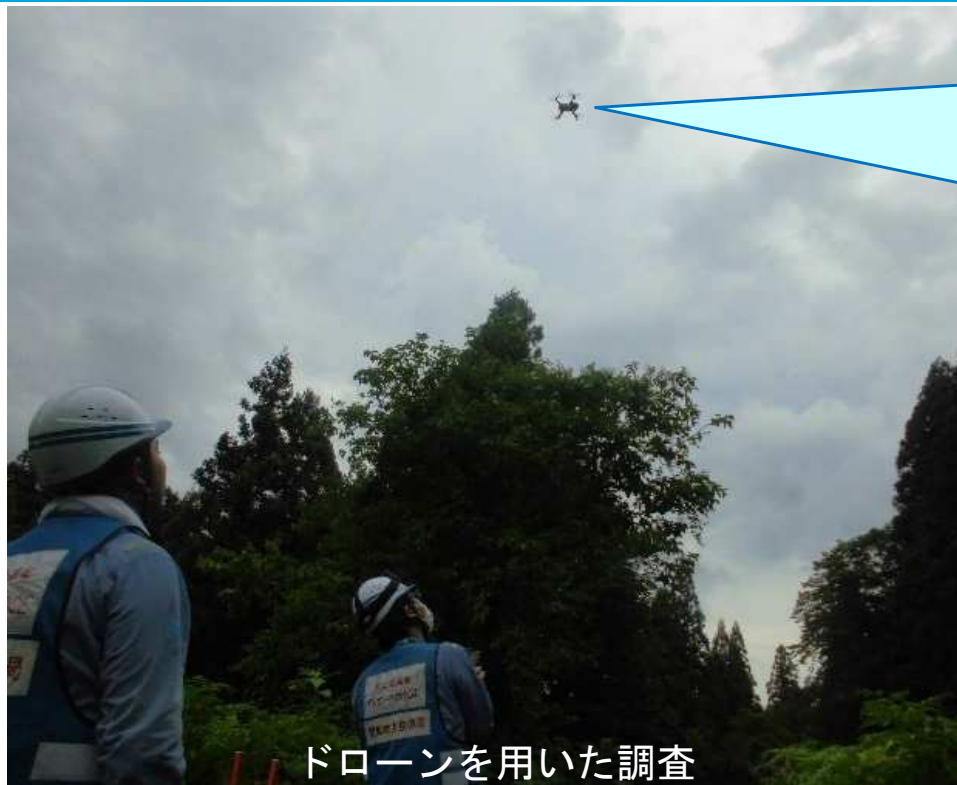
ドローンを用いた調査