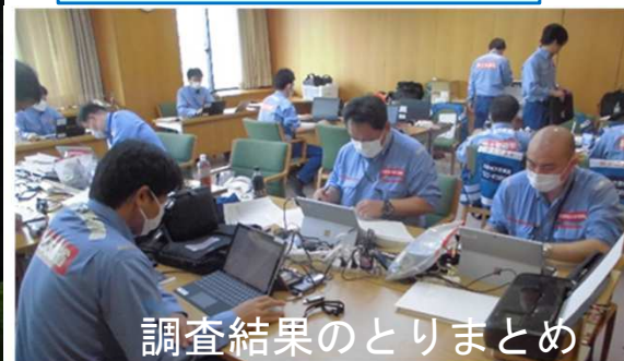
調査結果のとりまとめ