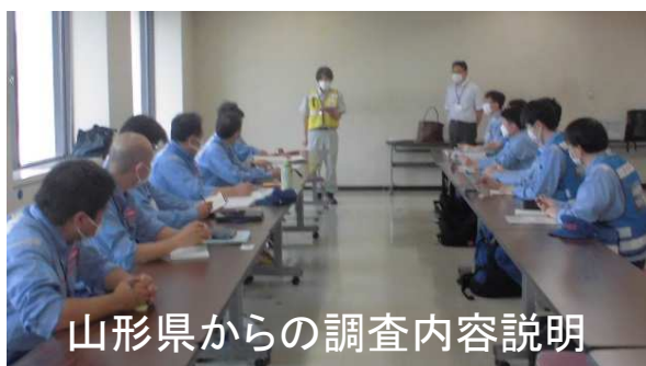
山形県からの調査内容説明

山形県小国町内の土砂災害警戒区域等に指定された土砂災害の危険箇所29箇所について、大雨による土砂災害の発生状況や被災状況を調査しました。