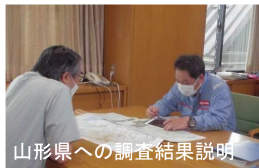
山形県への調査結果説明