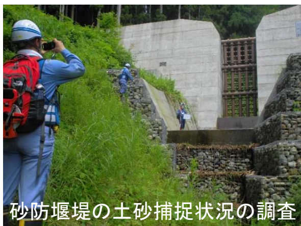
砂防堰堤の土砂捕捉状況の調査

山形県小国町内の土砂災害警戒区域等に指定された土砂災害の危険箇所29箇所について、大雨による土砂災害の発生状況や被災状況を調査しました。