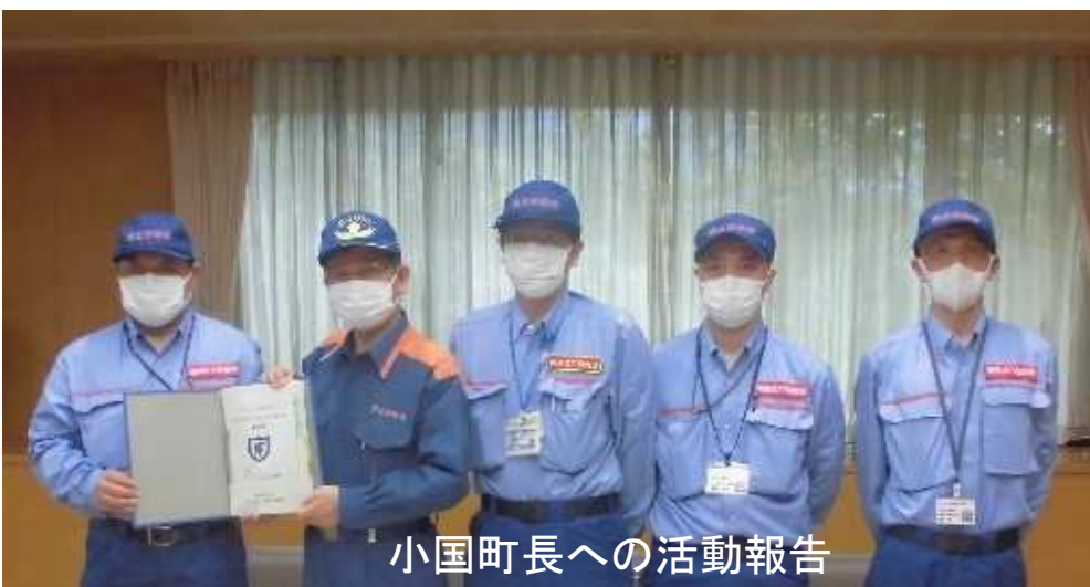
小国町長への活動報告