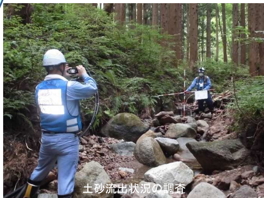
土砂流出状況の調査