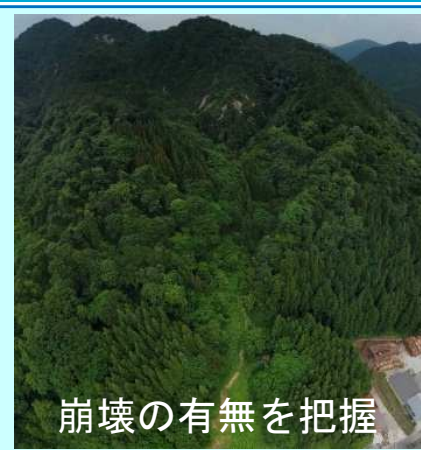
崩壊の有無を把握