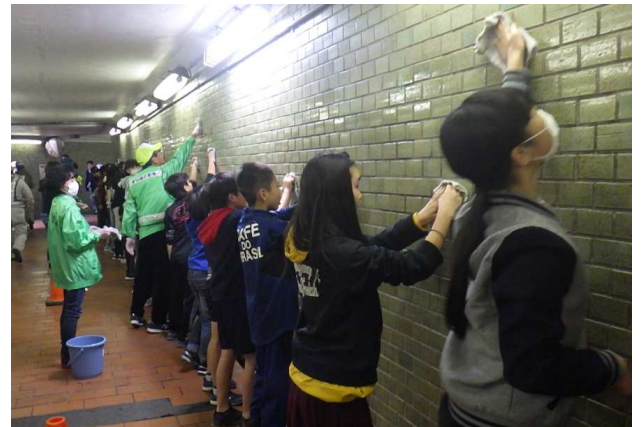
○地下道の壁面清掃