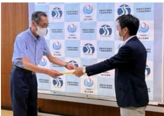
千葉国道事務所長より表彰状と記念品を伝達