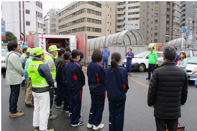
○開始前ミーティング