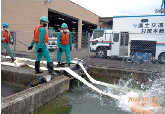
排水ポンプ車の訓練状況