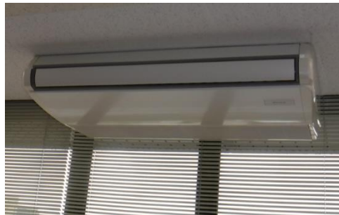
パッケージ型空気調和機