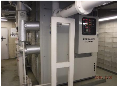
機械室 直焚令温水機

【庁舎】敷地面積 : 約5,964㎡ 構造 : 鉄筋コンクリート造 地上4階、地下1階 建築面積 : 約724㎡ 延べ面積 : 約3,441㎡ 用途 : 庁舎 工事内容 : 機械設備 改設一式 電気設備 改設一式 建築 改修一式