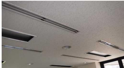
天井 空調吹出し口